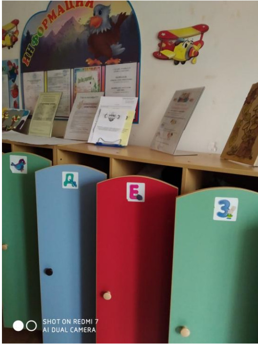
SHOT ON REDMI 7 AI DUAL CAMERA