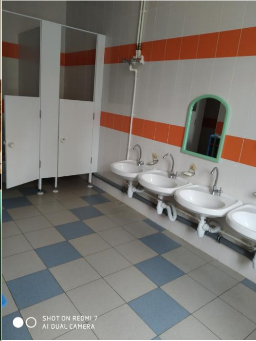
SHOT ON REDMI 7 AI DUAL CAMERA